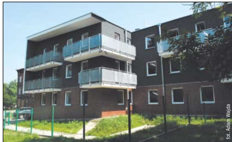
Najnowszy budynek TBS przy ul. Hutniczej w Bytomiu-Miechowicach

7 lipca był szczęśliwym dniem dla 14 lokatorów. Tego dnia oddano do użytku kolejny budynek wybudowany przez bytomskie Towarzystwo Budownictwa Społecznego Sp. z o.o.