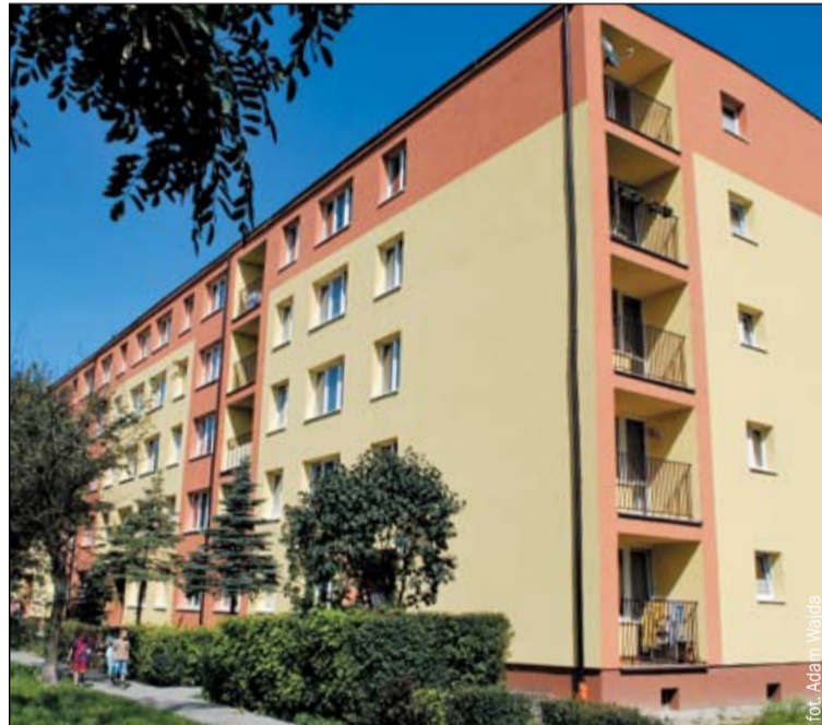
Ulica Godulska 2